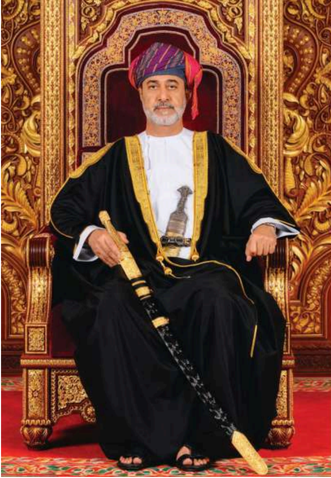
حضرة صاحب الجلالة السلطان هيثم بن طارق المعظم - حفظه الله ورعاه -