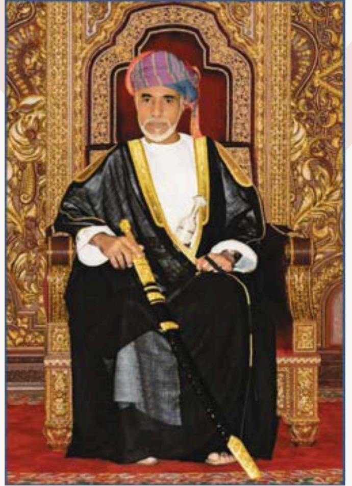
المغفور له جلالة السلطان قابوس بن سعيد بن تيمور -طيب الله ثراه-