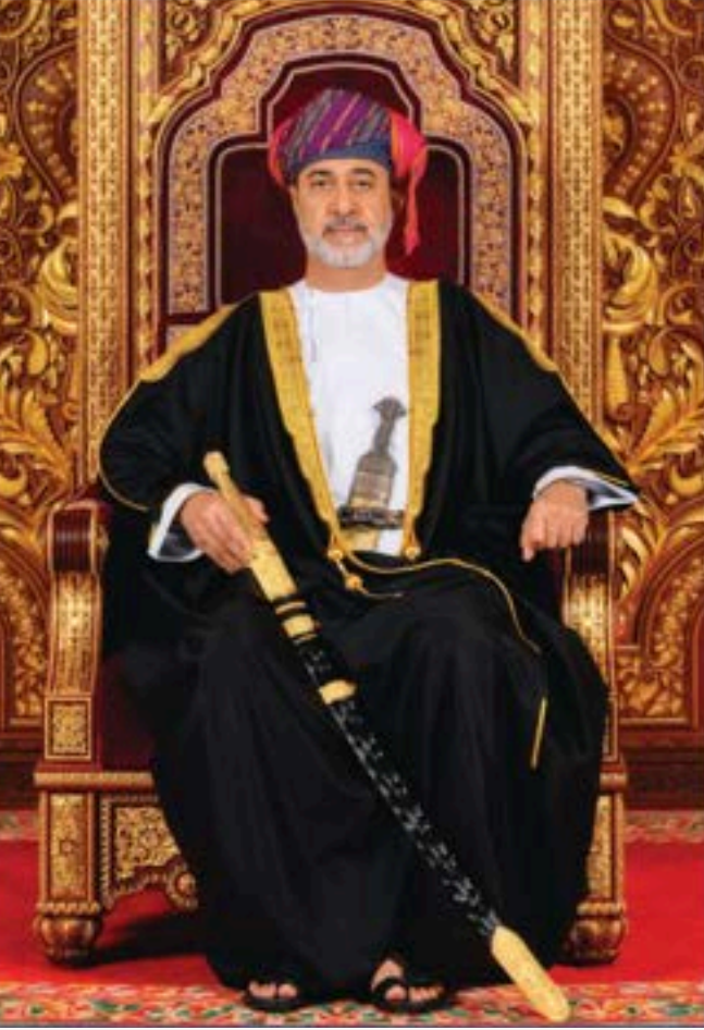
حضرة صاحب الجلالة السلطان هيثم بن طارق المعظم -حفظه الله ورعاه-