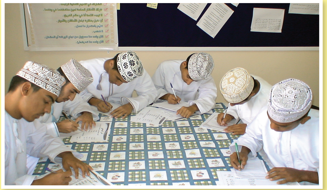
مجموعة من الطلبة أثناء تطبيق أحد التدريبات

يتملكون بعض المهارات الصحفية، ويقوم المعلمون بتدريب الطلبة على مهارات العمل الصحفي المختلفة من خلال المهارات التي اكتسبوها في الدورة المكثفة التي حضروها بدولة قطر.