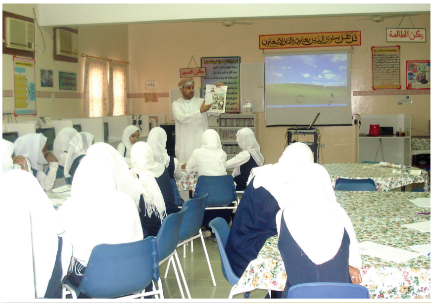
أحد المشاغل التدريبية في الفنون الصحفية