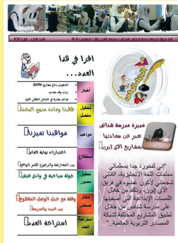
نماذج من نتاج الطلبة في المشروع