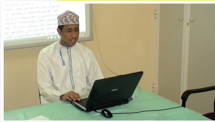
طالب يعرض تجربته في جماعة الخبر الصحفي

يعتبر مشروع تدريب الطلبة على العمل الصحفي (الطالب الصحفي المحترف) أحد مشاريع التعلم الإلكتروني التي تنفذها وزارة التربية والتعليم ممثلة في المديرية العامة لتقنية المعلومات بالتعاون مع شبكة المصادر التربوية الدولية (أي آيرن)، بهدف تنمية مهارات الطلبة في العمل الصحفي، وإكسابهم مختلف المهارات الصحفية كتحليل الخبر الصحفي، والتحقيق، والمقال، والحوار، والاستطلاع، والتصوير، والإخراج الصحفي، إضافة إلى تمكينهم في نهاية المشروع من إنتاج صحيفة إلكترونية وورقة باللغتين العربية والإنجليزية.