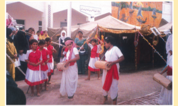
تحقيق ص ٢