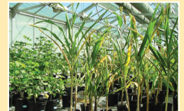
مهنة المستقبل ص ٣