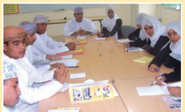
حلقة نقاشية ص ٤-٥