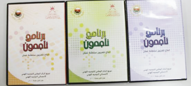
المركز الوطني للتوجيه المهني يقدم وسيلة تعليمية جديدة (أقراص مدمجة DVD لبرنامج ناجحون)