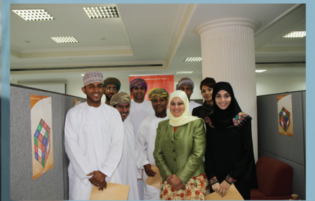
المركز الوطني للتوجيه المهني يكرم المشاركين في معرض مؤسسات التعليم العالي

الإثنين ٣ محرم ١٤٣٣هـ / الموافق ٢٨ نوفمبر ٢٠١١ م / العدد الثاني