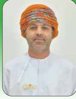
المستشار سالم بن محمد البوسعيدي