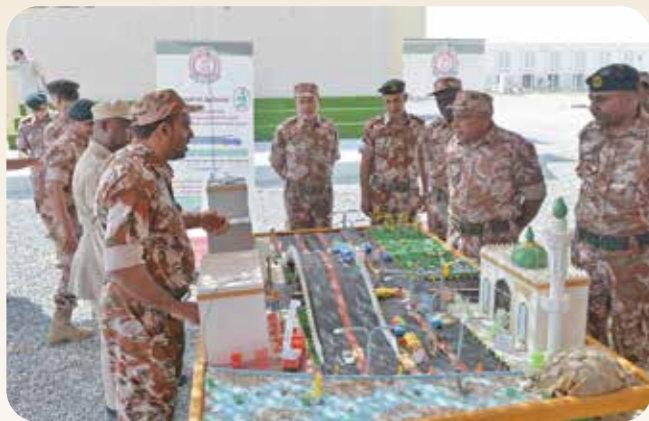
الخدمات الهندسية بوزارة الدفاع