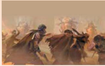
تصور لوقعة ذي قار