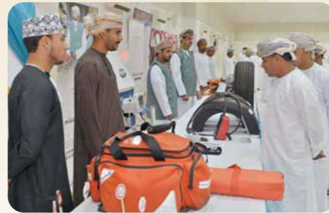
سلاح الجو السلطاني العُماني