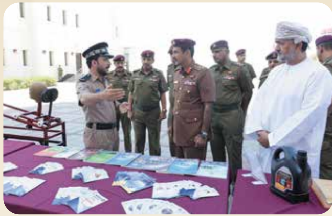
الحرس السلطاني العُماني