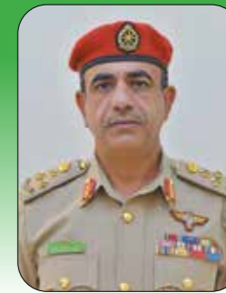
العميد الركن ياسر بن خليفة الطلبي

الندوة تهدف إلى خلق بيئة تعليمية تفاعلية تمكن المشاركين في الدورة من إعداد مبادرات تنفيذية في مجال الاستثمار تساعد صناعات القرار على تفعيل مقومات الدولة وعناصر قوتها الوطنية السياسية والاقتصادية والاجتماعية والإعلامية