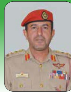
العقيد الركن سيف بن سعيد الرشدي