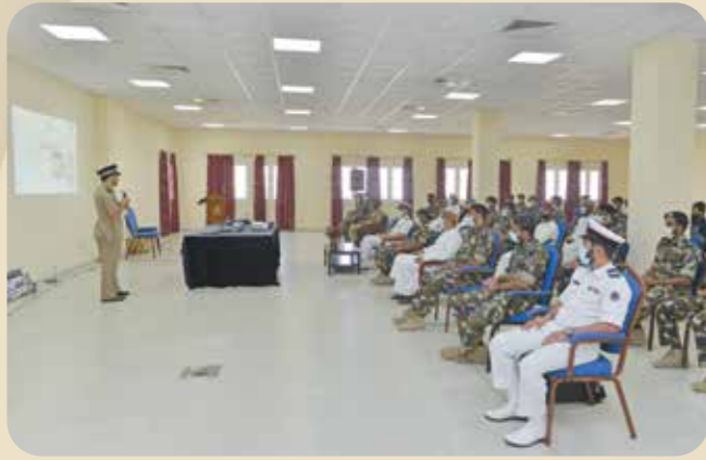
البحرية السلطانية العُمانية