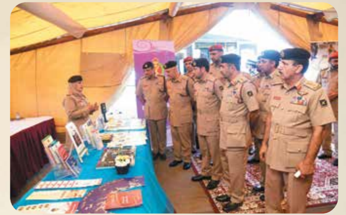
الجيش السلطاني العُماني