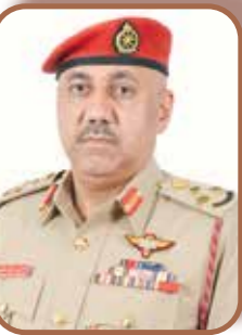
العميد الركن حسن بن علي بن عبد الله المجبني