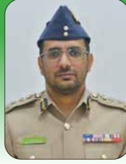
العقيد الركن جوي سعید بن علي الجبسي