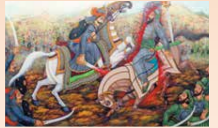
رسمه لتمودج الحيوانات (الخيول)