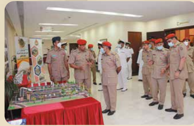
رئاسة أركان قوات السلطان المسلحة