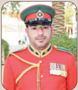
الوكيل أول / بدر بن عبدالله الصلهمي