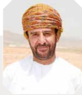
سعادة الشيخ / محمد بن سيف البوسعيدي

في إطار ما يسند إليها من مهام وواجبات وطنية، علاوة على توفير وإدامة الخدمات الضرورية مثل المياه والطاقة الكهربائية وشبكات الصرف الصحي ومرافق البنية الأساسية، كما تسهم الخدمات الهندسية في شق بعض الطرق في المحافظات المختلفة، مساهمة من وزارة الدفاع وقوات السلطان المسلحة في جهود التنمية الشاملة بالبلاد، إلى جانب الإسهام في نشر المسطحات الخضراء عن طريق إمداد الجهات المعنية بالمياه المعالجة، وتمتلك الخدمات الهندسية مشروع معدات البناء الشامل والذي يعد نقلة نوعية في تنفيذ المشاريع المختلفة من الأنظمة الحديثة المستخدمة في الخدمات الهندسية.