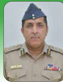
العقيد الركن جوي أحمد بن طالب البلوشي