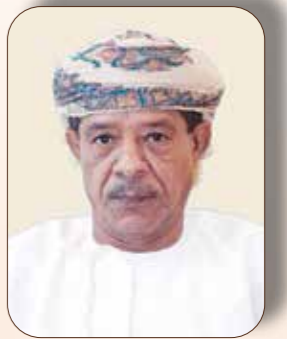
العميد الركن (متقاعد) / سعود بن سليمان الحبسي