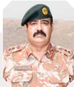
العقيد الركن / باسل بن سعيد البادي