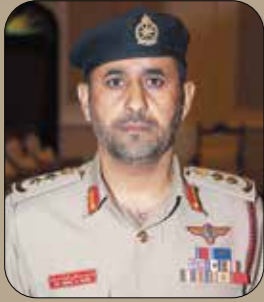
العقيد الركن / سيف بن حمود البوسعيدي