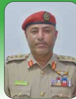
العقيد الركن عبد العزيز بن سعيد السعدي