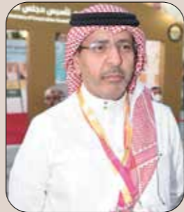
سعادة / خالد بن إبراهيم آل الشيخ