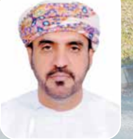
العميد أول الركن متقاعد/ محمد بن راشد البلوشي