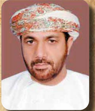
يكتبها: الدكتور علي بن عبد الله الكلباني *