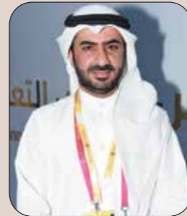
العقيد الركن / فهد بن محمد المطيري