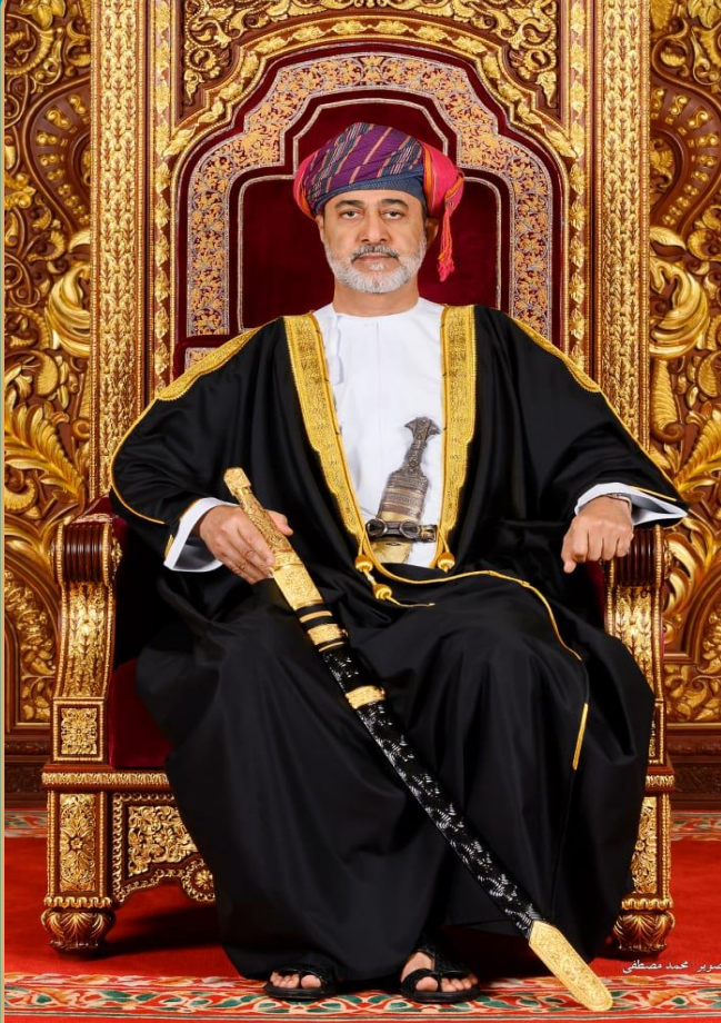
حضرة صاحب الجلالة السلطان هيثم بن طارق المعظم - حفظه الله ورعاه -