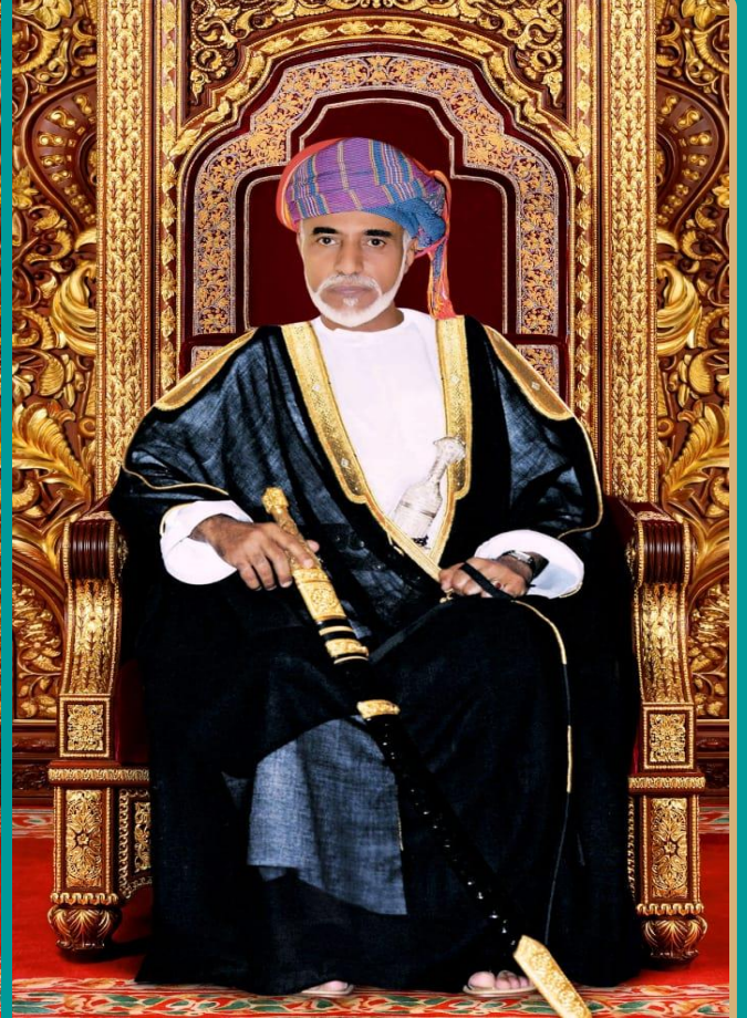
المغفور له بإذن الله السلطان قابوس بن سعيد - طيب الله ثراه -