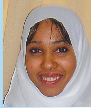
رياه عبد الرحمة: عدم تغيب الطالب بكسبه العديد مه المعازات والثقة بالنفس