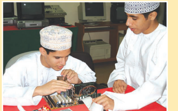
حلقة نقاشية ص ٤-٥