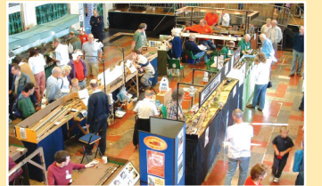
مهنة المستقبل ص ٣