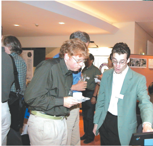
إعداد - يونس بن علي العنقودي

اللباقة وحسن التعامل أهم المواصلات الشخصية