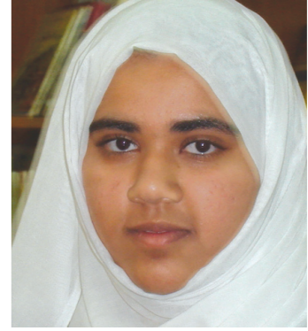
زينب الرجالية : الهواتف النقالة تجعل الطلاب يقضون ساعات طويلة في درسات لا منتفعة منها سوى خياب الوقت والمال

تعد الهواتف النقالة من بين العناصر المهمة في عملية الاتصال الشبكي وتقنية الاتصالات في وقتنا الحاضر، حيث تعتبر الإدارة الحرة المحمولة مع الفرد في كل وقت وحين، وأصبح الفرد في أي مجتمع من المجتمعات بحاجة إلى هاتف نقال يسهل عليه قضاء أعماله والتزاماته، فهي اختصار للجهد والوقت، ولكن السؤال الذي يطرح نفسه.. هل أصبح الهاتف النقال مشكلة تهدد طلابنا، على اعتبار أن الهواتف النقالة أصبحت في أيدي شريحة كبيرة من طلاب مدارسنا.