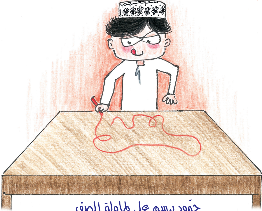
حمود يرسم على طاولة الصف Hamood draws on the class table