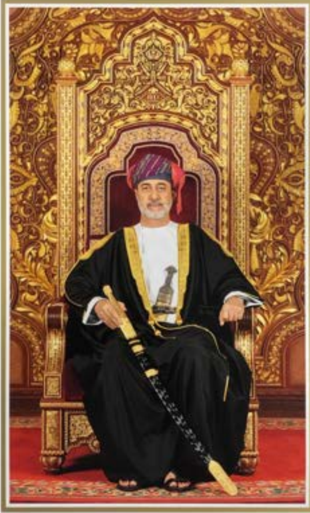
حضرة صاحب الجلالة السلطان هيثم بن طارق المعظم -حفظه الله ورعاه-